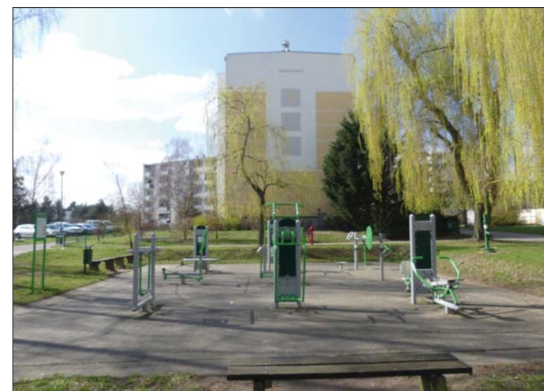
Specjalistyczne przyrządy gimnastyczne zachęcają do aktywnego wypoczynku

Na osiedlu prowadzona jest także systematyczna modernizacja sieci energetycznej. W ko-