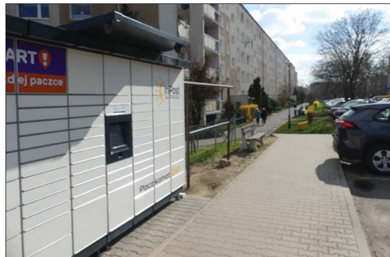
Na osiedlu przybywa paczkomatów

Na osiedlu mieszka się coraz wygodniej. Szkoła i przedszkola oraz przychodnia lekarska były