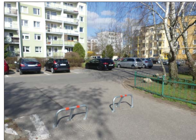
Nie wszystkimi osiedlowymi alejkami można przejechać

Obecnie „Veolia” planuje kontynuować oszczędnościowe przedsięwzięcia poprzez kompleksową modernizację wymienników ciepła w poszczególnych budynkach oraz zlikwidowanie węzłów grupowych. Zastosowanie nowoczesnych urządzeń usprawni dostawę ciepła oraz przyniesie oszczędności w jego zużyciu. Wiązać się będzie również ze zmianami w rozliczeniach za dostarczone cie-