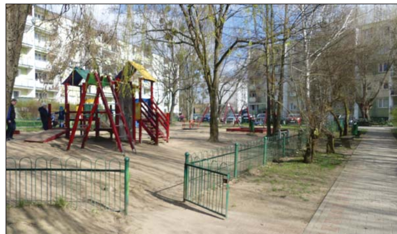
Osiedlowe place zabaw cieszą się dużym powodzeniem

na nim prawie „od zawsze” ale od niedawna mieszkańcy mają pod bokiem do wyboru dwa kościoły, dwa przystanki tramwajowe a nawet dwa paczkomaty. Pięknieje też otoczenie budynków. To między innymi wynik nieustannych zabiegów pielęgnacyjnych związanych z utrzymaniem drzew i trawników. Chociaż ogranicza się ich koszenie, to jednak przybywa zadań związanych z nasadzeniami czy podlewaniami. Stałej dbałości wymagają też osiedlowe place zabaw, które są licznie okupowane przez najmłodszych mieszkańców. Dla nieco starszych są urządzenia gimnastyczne i boiska do koszykówki oraz ze ścianką do tenisa. Jednak na niej chętniej zdają się ćwiczyć amatorzy street-artu, którzy często ozdabiają ją nieoczywistymi malunkami. (i)